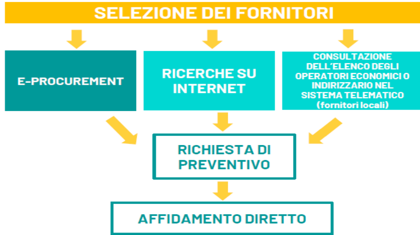
Schema per la SELEZIONE FORNITORI micro acquisti